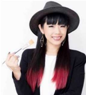
イラストレーター 絵子猫

イラストレーター絵子猫が描くブランド『ECONECO (エコネコ)』。ファンタジーな色合いと可愛いアニマル達がパレードをしている【ECONECO Animalparade】は、パステルカラーを多用し、ユニコーンやゾウなど個性あふれるキャラクターで大人かわいい世界観を表現。コスメや雑貨など幅広く商品化し、様々な年齢層に支持されています。