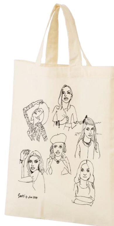
▲限定トートバック